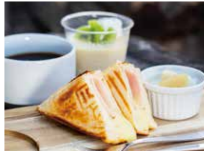
Cafe Cairn かふえ けるん

英彦山花園の近く、参道の長三洲跡地にて、カフェを営業しています。参道の散策に疲れたら、自然を感じられるテラス席でひと休みしませんか。