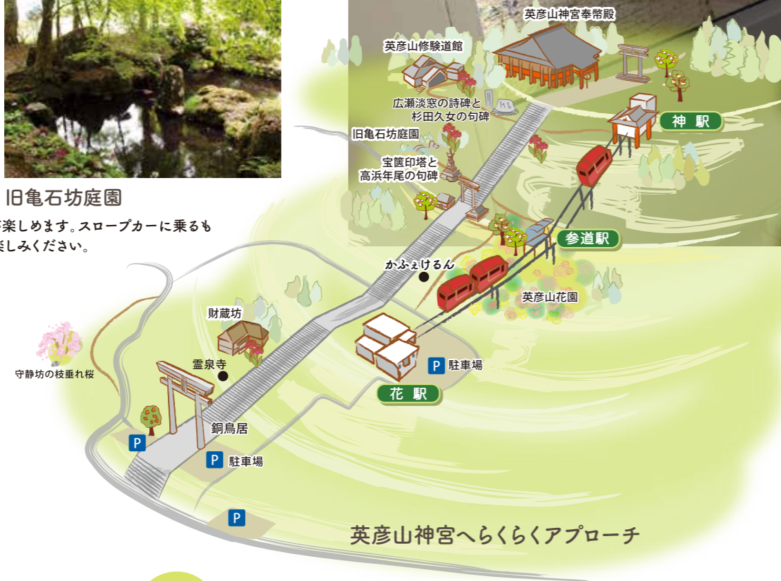
英彦山神宮へらくらくアプローチ

英彦山神宮へどなたでも手軽に参拝ができるように平成17年に英彦山スロープカーが開通して18年、デザインも新たに新型車両がデビューしました。車両や駅舎全てバリアフリーになっていますので、車椅子やベビーカーご利用のお客様も安全にご利用いただけます。皆様のご利用、お待ちしております。